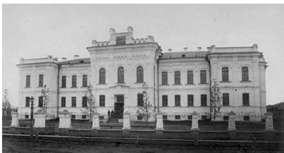
Рис. 1. Тюмень. Александровское реальное училище, архитектор Е.С. Воротилов (1880 г.)

тика здания проявилась в ритме рустованных пилястр, непрерывной ленте пологих «лучковых» арок над окнами второго этажа, поддержанных стилизованным аркатурным поясом под карнизом, а мелкая пластика фасада отразила тектонические возможности кирпича и сгладила излишнюю монументальность.