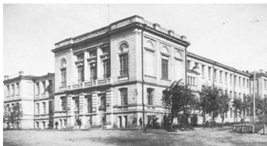
Рис. 5. Омск. Коммерческое училище инженера А.Ф. Черноморченко (1916 г.)

Разветвленная планировочная структура здания отвечала всем требованиям современного оснащения (электрическое освещение, центральное отопление, водопровод, вентиляция) и оборудования (мебель, наглядные пособия, коллекции).