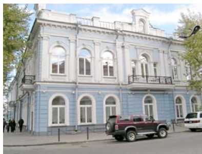
Рис. 2. Иркутск. Второе коммерческое училище (1912 г.)

Планировка здания включала двадцать помещений: учебные классы, специально оборудованные кабинеты и мастерские. В 1886 г. коммерческое отделение было закрыто ввиду незначительного набора учащихся [4].