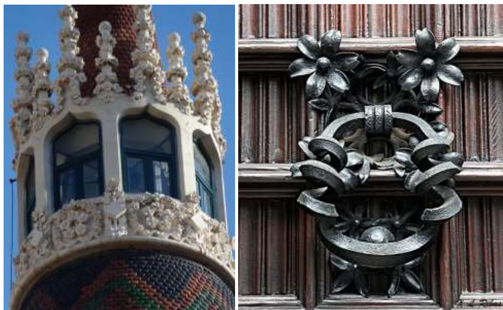
Рис. 13. Образцы каменных и металлических декоративных элементов на фасадах Casa Terrades ( http://farm9.static.flickr.com/8069/8248502576_f488b77fed.jpg ; https://c1.staticflickr.com/9/8616/16530551688_07c5485e06.jpg )

ществлена его реконструкция. Сейчас Casa de les Punxes является частным владением и закрыт для посещений.