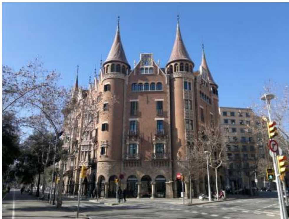
Рис. 11. Дом Террадес (Casa Terrades, Casa de les Punxes, 1903–1905 гг.) ( https://fotografiasdecuidad.files.wordpress.com/2011/02/barcelona_casapunxes4.jpg )

Дом Террадес (Casa Terrades, Casa de les Punxes) был построен в 1903–1905 гг. Это самый крупный из всех реализованных проектов Жозепа Пуч-и-Кадафалка, выполненный им для трех сестер Террадес (Terrades). Сестры владели тремя жилыми домами, занимающими целый квартал между проспектом Авингуда Диагональ (Avinguda Diagonal, 416–420), улицей Россельо ( carrer Rosselló ) и улицей Брук ( carrer Bruc ) [7–9]. Состоятельные заказчицы поручили зодчему выполнить перепланировку внутреннего пространства квартала и их домовладений. Кроме того, они попросили изолировать это пространство от посторонних лиц. Исполняя их пожелания, архитектор сумел превратить три дома, принадлежащих сестрам, в один, отдаленно напоминающий средневековый замок с шестью угловыми башнями, увенчанными коническими шпилями-«шипами» ( Punxes ). Его шесть не похожих друг на друга и «поражающих воображение» фасадов выходили на все три улицы (рис. 11).