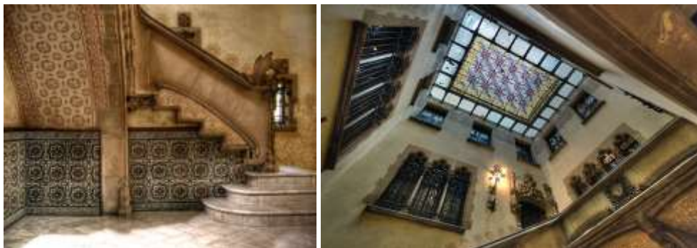
Рис. 10. Интерьеры Дома Амалье (Casa Amatller). Лестничный марш, вестибюль ( http://красотамания.рф/wp-content/uploads/2012/10/interior-design-remodeling-foyer-Casa-AmatllerJ-Salmoral-pic.jpg ; http://www.barcelona-trip.ru/dom-amalie/ )

В традициях каталонского модерна решены и интерьеры дома (рис. 10).