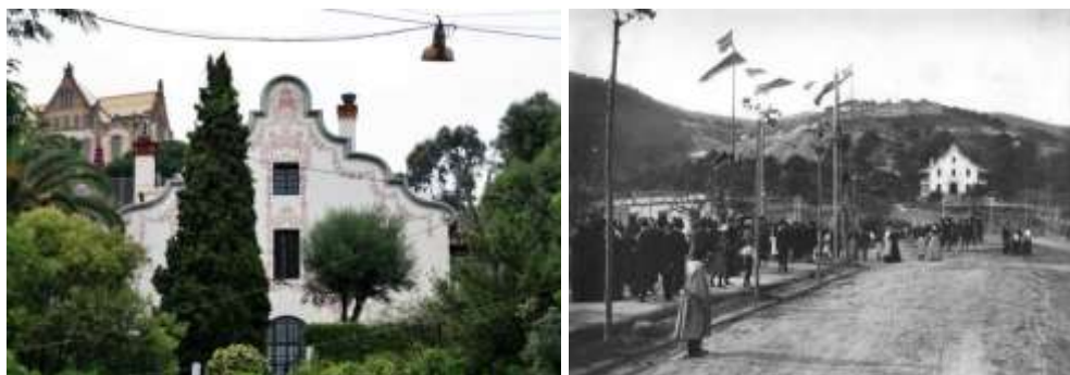
Рис. 16. Здание компании Muntades (Casa Muntades, 1901 г.). Современное состояние, фотоснимок начала XX в. ( http://m8.i.pbase.com/g4/47/949547/2/135449828.Tlg0bb5n.jpg ; https://upload.wikimedia.org/wikipedia/commons/7/76/PiC_casa_Muntades_1901.jpg )

дерные элементы – из этого набора сформировался стиль неоклассицизм (ноу-усентизм, Noucentisme) первой трети XX в.