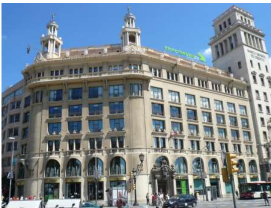
Рис. 17. Здание Испанского кредитного банка ( Banco Español de Crédito ) на площади Каталонии, или Дом Пич-и-Пон (Casa Pich i Pon a la plaça de Catalunya, 9, 1919–1921 гг.) ( https://upload.wikimedia.org/wikipedia/commons/1/15/Casa_Pich_i_Pon.jpg )

Наиболее известным проектом Ж. Пуч-и-Кадафалка, выполненным в этом стиле, является здание Испанского кредитного банка ( Banco Español de Crédito ), или Дом Пич-и-Пон (Casa Pich i Pon), которое находится на площади Каталонии ( Plaça Catalunya , 9, угол с Rambla de Catalunya ) (рис. 17) [12].