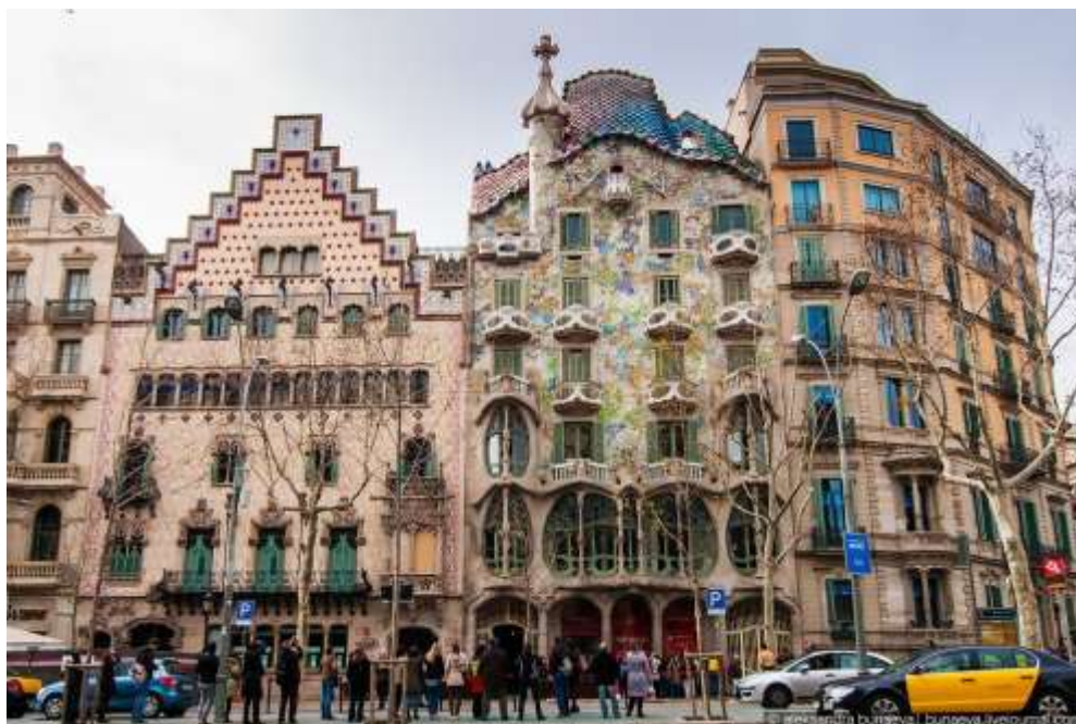
Рис. 7. Каса Амалье (Casa Amatller) и Каса Бальо (Casa Batlló) Антонио Гауди ( http://www.terra-z.ru/wp-content/uploads/2015/01/117.jpg )

ния, соседствующих с Каса Амалье, – Каса Бальо ( Casa Batlló ) Антонио Гауди и Каса Льео Морера ( Casa Lleó Morera ) Луиса Доменек-и-Монтанера. Любопытно, что ни одно из этих зданий не является вновь построенным; все три – реконструкции уже существующих домов. Дом Амалье появился первым. Прилегающая территория оснащена широкими тротуарами, вдоль которых выстроились магазины, фешенебельные ювелирные салоны, художественные галереи, кинозалы, гостиницы, кафе, рестораны и многочисленные торговые лавки. Уличные фонари работы Пере Фалькеса и дизайн пешеходной мостовой, которая проложена вдоль дома Амалье, выполнены по проекту А. Гауди.