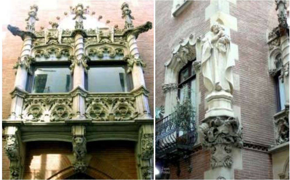
Рис. 4. Декоративные детали Каса Марти (Casa Martí). Лоджия бокового фасада, скульптура святого Иосифа с младенцем Иисусом на руках

встреч для интеллектуальной элиты города. По случаю открытия кафе его директор Сантьяго Русиньоль составил своеобразный манифест заведения: «Это привал для утративших веру; это теплый угол для тех, кому нужен дом; это музей для тех, кто ищет просветления души; это таверна и место отдохновения для тех, кто любит пляшущие тени мотыльков и выжимку виноградной лозы; это готическая пивная для любителей Севера и андалусский дворик для любителей Юга; это место, где можно залечить болезни века; место дружбы и гармонии для тех, кто, согнувшись, проходит через эту дверь...»