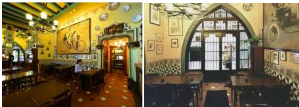
Рис. 6. Интерьеры кафе «Четыре кота» в Барселоне. Современное состояние ( http://multimedia.catalunya.com/mds/multimedia/5755/F1 ; http://www.mishanita.ru/data/images/Spain_2006/Quatre-Gats3.jpg )

Кафе Els Quatre Gats сохранило не только дух парижских кабаре, но и испанские традиции тертулий ( tertulias ) – собраний и дружеских застолий интеллектуалов. Хозяин заведения нередко подсаживался за столик к посетителям и вел дискуссии на тему переустройства мира. Здесь организовывались