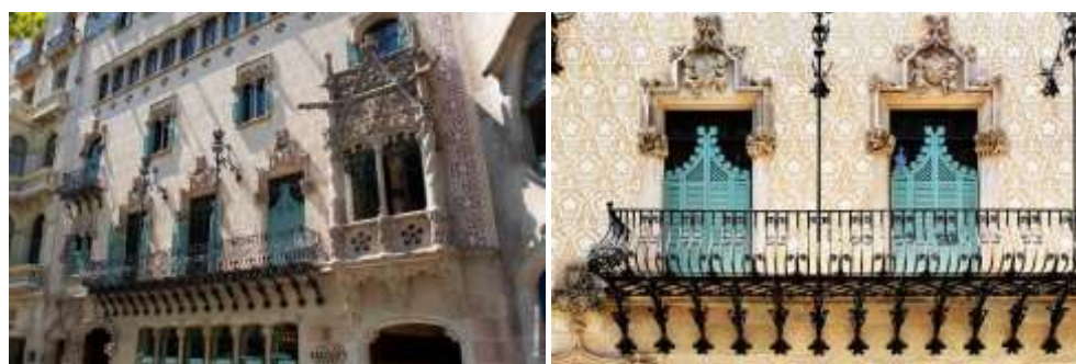
Рис. 8. Фасад дома Амалье (Casa Amatller) ( http://lowkee.com/pictures/barsa6.jpg ), фрагмент второго этажа ( http://www.terra-z.ru/wp-content/uploads/2014/08/51.jpg )

зрителя к основной профессии заказчика. Привлекают внимание прохожих очаровательные барельефы, росписи и стилистический орнамент, выполненные в технике сграффито. С таким же очарованием соединяются на фасаде керамика, детали из кованого железа. Скульптурное оформление фасада выполнено главным образом Эусеби Арнау-и-Маскортом ( кат. Eusebi Arnau i Mascort). Главный вход украшен сюжетами на библейские темы (в частности, фигурой святого Георгия, сражающегося с драконом) и персонажами средневековых легенд. Здесь можно увидеть драконов и рыцарей, безруких барабанщиков с танцующими медведями и даже дочь хозяина дома в образе принцессы (рис. 9).