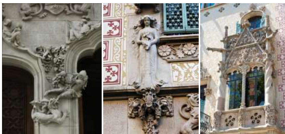
Рис. 9. Скульптурное оформление дома Амалье ( http://niernsee.ru/barselona/amatller/barca007.jpg ; http://lowkee.com/pictures/barsa20.jpg ; http://media-cache-ak0.pinimg.com/736x/d0/7f/1c/d07f1cfae326773da83f5b5b1e07689c.jpg )

Скульптурные композиции обрамляют двери и окна на первом и втором этажах. Выше находятся изображения, представляющие основные виды искусства – музыку, живопись, скульптуру и архитектуру. Здание имеет два входа. Более высокий был предназначен для въезда в вестибюль запряженных