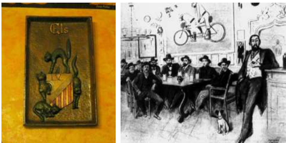
Рис. 5. Эмблема кафе «Четыре кота» и его самые знаменитые посетители

и графиком, мастером портрета и карикатуры, лидером национального модернизма. Именно он оплатил изготовление массивных круглых люстр и «средневековой» мебели по эскизам Л. Пуч-и-Кадафалка. По его же инициативе большую часть стен кафе заняли картины и разноцветные керамические панно. Их авторами были завсегдатаи кафе. На стене был начертан девиз заведения: «Человеку, чтобы жить в свое удовольствие, нужна хорошая еда и вдоволь смеха!» (L' home que he vulga viure, Bons aliments y molt riure!) (рис. 6).