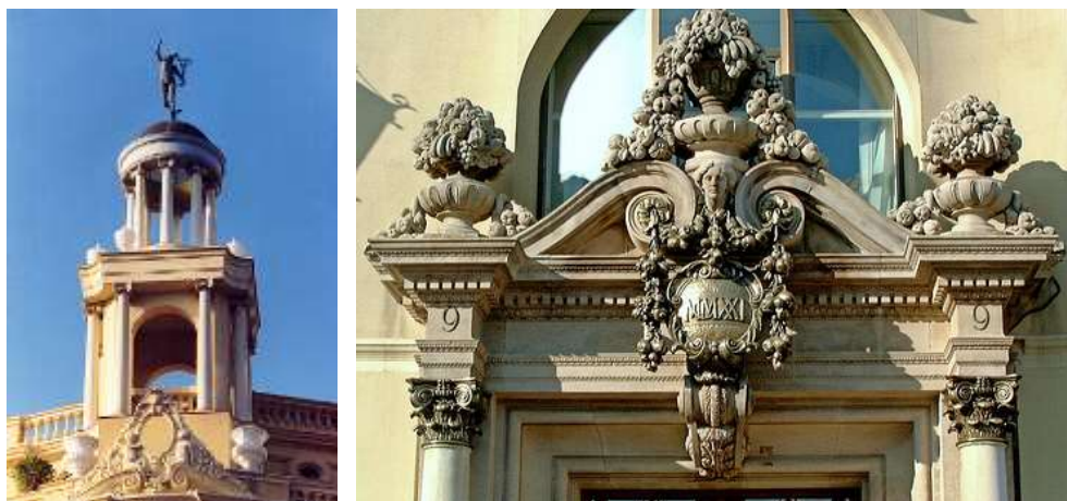
Рис. 18. Casa Pich i Pon (1919–1921 гг.). Башенка на крыше и карниз входного портала ( http://img.webme.com/pic/i/ignasiguillen/angel.jpg ; http://media-cache-ak0.pinning.com/736x/fb/df/ff/fbdf30d6328b1976a6edb4a6aa8d92.jpg )

По их словам, они опирались на такие жизненные ценности, как «порядок, ясность, гармония, рациональность и умеренность». Это было социальное и гражданское искусство, открытое всем «прогрессивным» европейским течениям. Оно стремилось поднять каталонское искусство на мировой уровень. Согласно этому учению, исторической основой для культуры народов северного побережья Средиземного моря была и остается античная греко-римская культура. Поэтому неоклассика рассматривалась как часть национальной идентичности каталонского народа и противопоставлялась «модернизму» североевропейского происхождения. Следуя новой моде, Пуч-и-Кадафалк украсил портал здания элементами каталонского барокко. В целом фасад выдержан в духе европейского классицизма и историзма. Две башенки по углам придали дому монументальность и особое изящество (рис. 18).