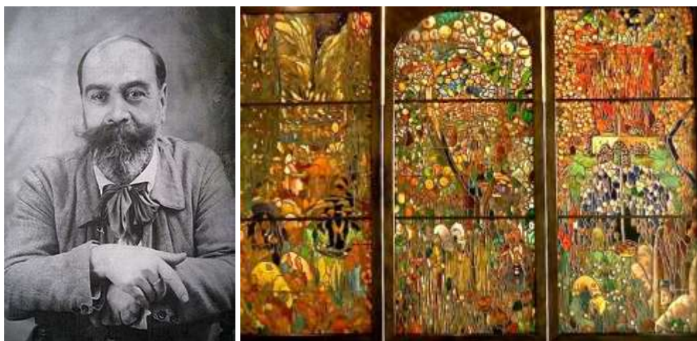
Рис. 15. Каталонский пейзажист Жоакин Мир-и-Триншет (Joaquin Mir Trinxet, 1873–1940) и его картины в Casa Trinxet (1904 г.) ( http://4.bp.blogspot.com/-7sSTCrc7FYw/UKP58uuEcpI/AAAAAAAAxhg/7WEKkzz3_-Q/s320/Joaquin_Mir-2689sh.jpg ; http://media-cache-ak0.pinning.com/736x/18/01/68/180168585a2952b56d030565f29ad1f6.jpg )

Третье направление в творчестве Ж. Пуч-и-Кадафалка было связано с его увлечением зодчеством Древнего Рима и итальянского Возрождения. Этот период параллелен с подготовкой и празднованием международной выставки в 1929 г. в Барселоне, где Жузеп исполнял обязанности главного архитектора. Стены желтого цвета, многочисленные миниатюрные колонны и ор-