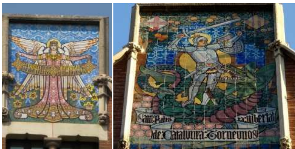
Рис. 12. Панно на фасадах Casa Terrades («Фигура ангела», «Св. Георгий») ( http://2.bp.blogspot.com/-usKIdj06vgM/UJq_nPDjweI/AAAAAAAAAwSg/BnAAi5Ll5_w/s640/686px-Casa_de_les_Punxes+SANT+JORDI.jpg )

Самое известное панно обращено на улицу Rosello. На нем изображен святой Георгий (San Jorge), сражающийся с драконом. Надпись гласит: «Святой покровитель Каталонии, верни нам независимость!» (Santo Patró de Catalunya, devuélvenos la llibertat!). Не исключено, что это – персональный «фирменный знак» зодчего, отмечающий все его постройки (рис. 12).