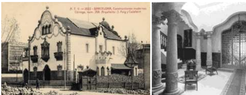
Рис. 14. Усадьба Жоакина Мир-и-Триншета (Casa Trinxet, 1904 г.). Фотоснимок начала XX в. Интерьер дома (современное состояние)

да, роса, осевшая на листьях, трава, проросшая внутрь забора. Отмечено, что эти работы создают в комнатах благоприятную энергетику (рис. 15) [10, 11].