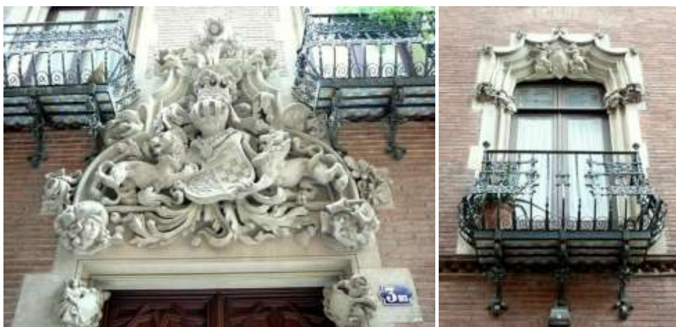
Рис. 3. Декоративные детали Каса Марти (Casa Martí). Входной портал, окно ( http://www.picshare.ru/uploads/140308/PZLD6jY4v0.jpg ; http://www.picshare.ru/uploads/140308/W8pn0F4426.jpg )

Отличительными особенностями архитектуры этого особняка являются широкие заостренные кверху «стрельчатые» арки с витражами на первом этаже, а также причудливый орнамент и декоративные элементы в стиле «пламенеющей» готики на окнах и балконах верхних этажей (рис. 3).