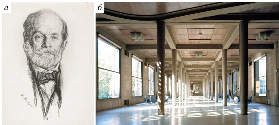
Рис. 4. Огюст Перре (а); «железобетонный» интерьер Йенского дворца (Palais d'Iéna) в Париже (б)

ним пальцами. Ле Корбюзье открывает, что действительность не имеет ничего общего с тем, как это изложено в учебниках. Здесь каждая вещь – откровение, игра солнечного света... К этому времени относится его наиважнейший и непререкаемый совет: поверить можно лишь после того, как увидел, обмерил... и потрогал пальцами!...» [1].