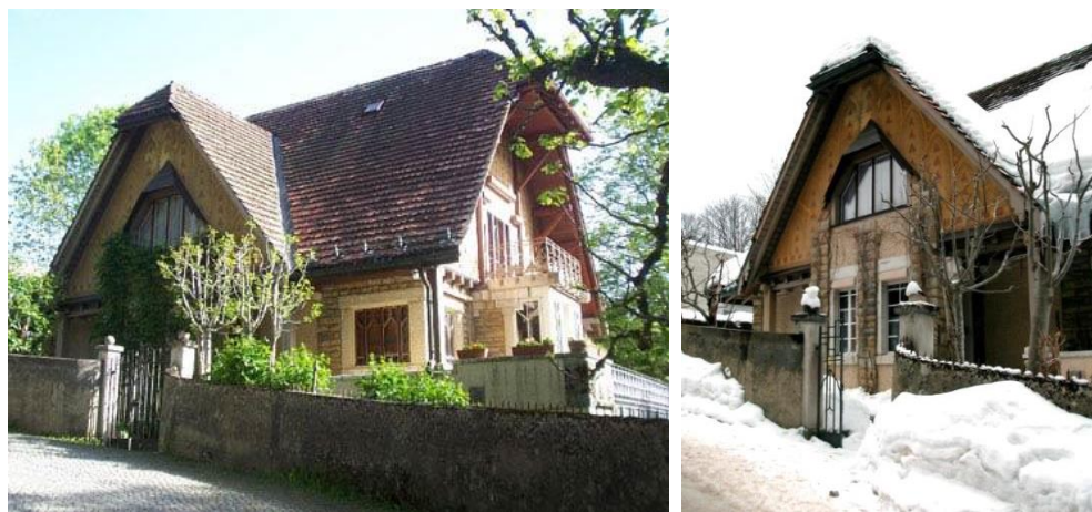
Рис. 2. Вилла Фалле (Villa Fallet) (г. Ла Шо-де-Фон, Швейцария, 1905). Видовые точки