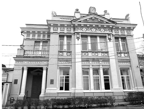
Рис. 2. Особняк А. Великановой. Вид с юго-запада. Фото Ю.В. Петрусенко, 2018 г.

Особенностью такого типа здания, как «особняк», является определенная степень свободы от внешних условий практического характера и от сложившихся художественных традиций прошлого. «Особняк – наиболее свободный, гибкий и мобильный тип зданий. Он менее зависит от утилитарных требований и строительных стандартов, чем, например, многоквартирный дом» [5, с. 12]. Планировочные и композиционные решения особняка представляют собой индивидуальную завершенность. В особняке наиболее полно могут выразиться творческие концепции автора проекта и своеобразные предпочтения заказчика. Практическая реализация основных характеристик данного типа здания требовала определенных градостроительных, экономических и культурных условий.