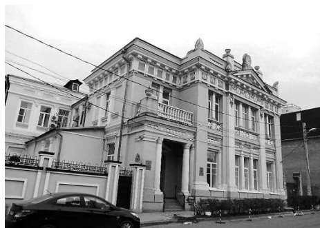
Рис. 4. Особняк А. Великановой. 2018 г.