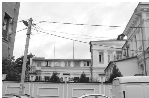
Рис. 5. Особняк А. Великановой. Западное крыло.

Постройкам конца XIX – начала XX в. присуща стилистика модерна. Модерн получил свое развитие в России в 1890–1910-е гг. Для решения внешнего облика зданий присуще использование архитектурных декоративных элементов, подчеркивающих конструктивные особенности здания. При формировании пластики фасада для модерна характерны обрамление проемов, ритмическая закономерность и форма оконных проемов на фасаде, переплет, оформление балконов и лестниц, формирование общего силуэта здания. Подчинение фасадов основным композиционным приемам, таким как асимметрия, ритмичность, динамичность, живописность [11]. Декору в стиле модерн присущи упрощенные, стилизованные формы орнамента растительного происхождения, располагающегося на гладкой поверхности стены и образующего своего рода декоративные вставки. Автор, создавая форму, тот или иной объем здания, внешним видом стремится показать внутреннее строение и функциональное назначение помещений. Расположение оконных и дверных проемов является главным акцентом на фасадах зданий, подчиняющихся основным композиционным приемам.