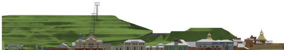
Рис. 3. Проектные предложения по организации туристско-рекреационного кластера «Барнаул – горнозаводской город» (ИнАрхДиз АлтГТУ, 2013 г.): развертка по улице И.И. Ползунова

Предполагаемые сроки реализации концепции – 2015–2034 гг. Очередность реализации: 1-й этап – 2014–2019 гг.; 2-й этап – 2019–2024 гг.; 3-й этап – 2024–2029 гг.; 4-й этап – 2029–2034 гг.