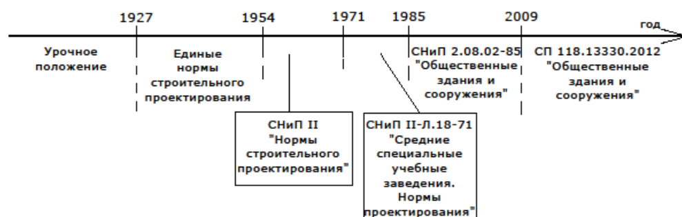
Рис. 1. Изменение нормативной базы

В границах изучаемого исторического периода нормативное законодательство, касающееся строительства и проектирования школ, существенно менялось шесть раз (рис. 1) [6].