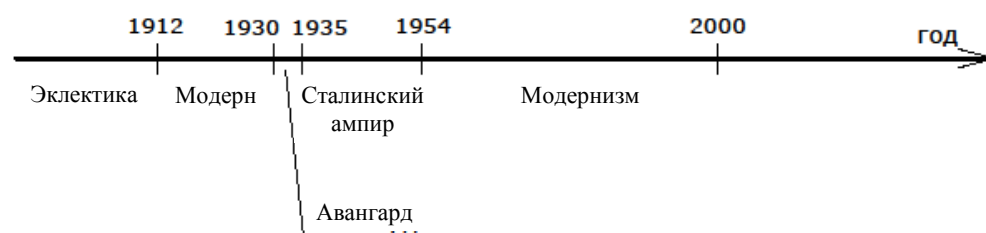
Рис. 3. Изменение стилистики школ

Следует отметить, что при анализе стилистики и конструктивной системы школ Новосибирска предлагаемая датировка периодов носит приблизительный характер.