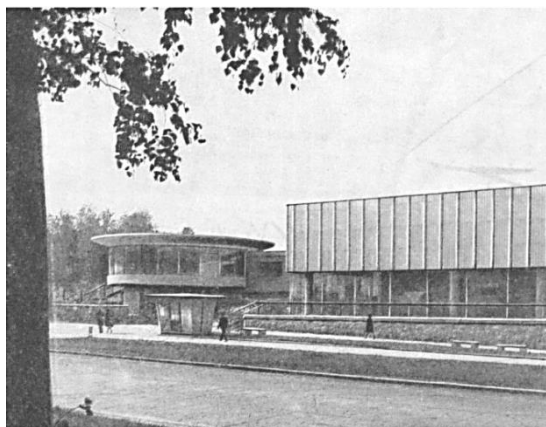
Рис. 3. Торговый центр. МИАС им. С.Н. Баландина 4 Fig. 3. Shopping center

Проводя параллели с зарубежной архитектурой, ближе всего видится центр Тапиолы в Финляндии (архитектор А. Эрви), строительство которого осуществлялось в это же время (рис. 4); студенческий клуб «Диполи» в Отаниеми (архитекторы Р. Пиетиля и Р. Паателайнен, 1960–1966 гг.).