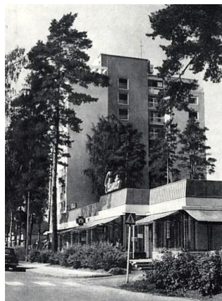
Рис. 4. Центр восточного района Тапиолы. А. Эрви 5 Fig. 4. Center of the eastern district Tapiola. A. Ervi

В самом городе новые стилевые направления проявились во второй половине 1960-х – 1970-е гг.