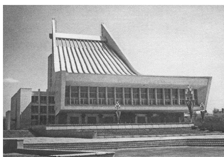
Рис. 9. Музыкальный театр в Омске [5, с. 278] Fig. 9. Music Theatre in Omsk

Пример модернизма – застройка Красного проспекта от путепровода до ул. Кропоткина, по проекту архитекторов А.А. Сабирова и М.И. Стародубова в 1965–1969 гг., удачно вписанная в рельеф [1, с. 87]. Здесь пространство города также сливается с пространством зданий за счет прозрачных витражей, выноса части зданий над первым этажом. Главная улица города на достаточно