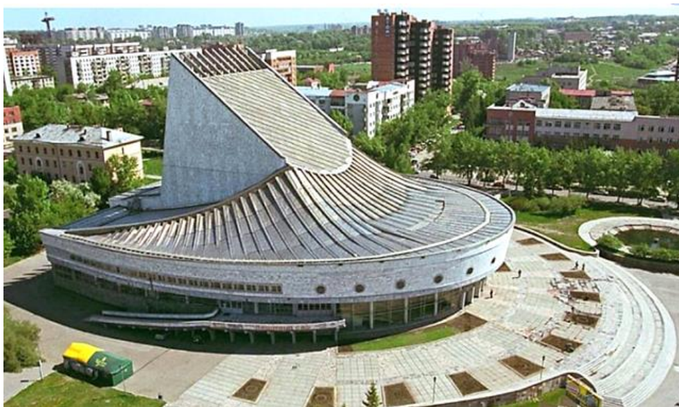
Рис. 7. Театр «Глобус» в Новосибирске 5 Fig.7. The Theatre "Globus" in Novosibirsk

Аналогичная конструктивная система использована в здании Омского музыкального театра, но здания выглядят по-разному – иной градостроительный контекст, иные задачи (рис. 9).