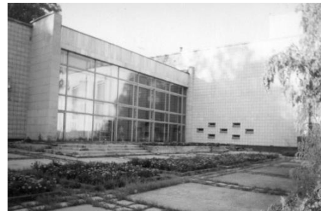
Рис. 2. Дом ученых. Вид со стороны парковой зоны. Fig. 2. The House of Scientists. View from the park area.