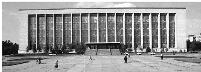
Рис. 5. ГПНТБ. Общий вид [10] Fig. 5. Scientific Library

«Четкая функциональность, его ясная плановая структура, простор холлов, коридоров и лестниц создают большие удобства для читателей библиотеки. Несомненно, здание ГПНТБ явилось значительным градоформирующим объектом» [1, с. 90] (рис. 5, 6).