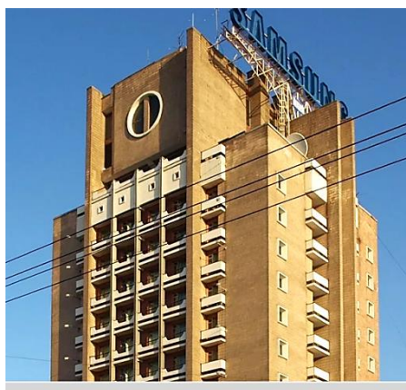
Рис. 12. Гостиница «Октябрьская» 8 Fig. 12. "Oktyabrskaya" Hotel

На проспекте Дзержинского был построен Дом культуры им. Чкалова, позже административный объект – Дом Советов. Использование типовых решений общественных зданий не было механистичным, здания органично составили основу планировочных подцентров крупнейшего сибирского города: Дом культуры Железнодорожников по ул. Челюскинцев, Дом культуры Строителей, кинотеатры – «Аврора», «им. Маяковского», «Горизонт». Появились крупные магазины самообслуживания (ЦУМ, универсам, ГУМ и др.). На Красном проспекте, главной улице города, построен Дом быта. Эти здания имели градоформирующее значение, развивали центральные функции, закладывали основу для формирования композиции города.