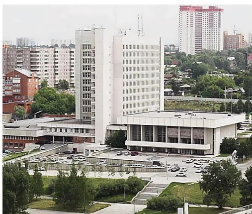
Рис. 11. Комплекс обкома КПСС 7 Fig. 11. The complex of the Regional Committee of the CPSU