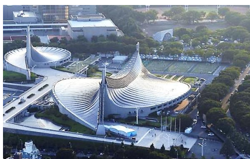
Рис. 8. Олимпийский спортивный комплекс в Йоёги [12] Fig. 8. Olympic Sports Complex in Yoyogi

Аналогичная конструктивная система использована в здании Омского музыкального театра, но здания выглядят по-разному – иной градостроительный контекст, иные задачи (рис. 9).