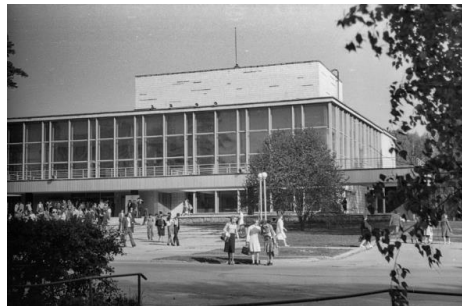
Рис. 1. Дом ученых 3 Fig. 1. The House of Scientists

Главное здание общественного центра – Дом ученых. Архитекторы: Л. Лавров, М. Левин, И. Орлов, А. Ротин, Т. Сафонова, Ю. Ушаков, инженеры: В. Панов, Л. Помазова, Е. Усанов, 1962–1968 гг. [3, с. 178] (рис. 1, 2).