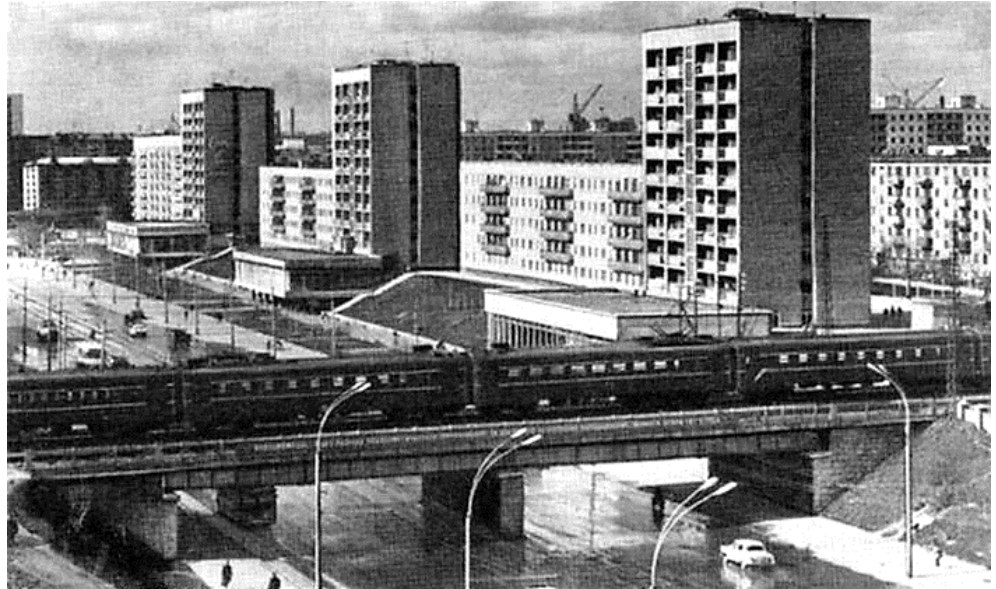
Рис. 10. Красный проспект от путепровода до ул. Кропоткина 6 Fig. 10. Krasny Prospekt from the overpass to Kropotkin Street

большом участке получила единое ансамблевое решение. Жилые здания включены в общее пространство, формируют его, в то же время сохраняют необходимую изолированность благодаря удалению от красной линии проспекта на более высокие отметки рельефа и озеленению. 9-этажные «башни» задают ритмичность, контрастны строчной 5-этажной застройке (рис. 10).