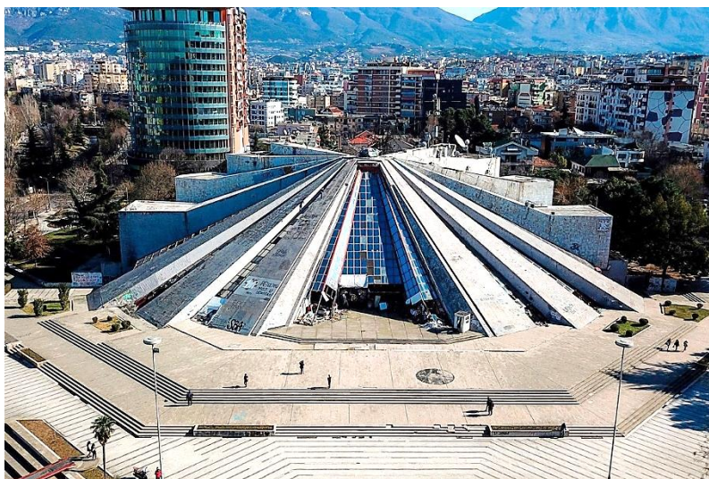
Рис. 1. Первоначальный вид Пирамиды 1 Fig. 1. The initial form of the Pyramid of Tirana

Появление здания в 1980-х гг. связано с именем албанского коммунистического лидера Энвера Ходжи [2], который правил страной почти сорок лет (с 1946 по 1985 г.) и превратил Албанию в одну из самых закрытых стран в мире и самую отсталую страну в Европе (рис. 1).