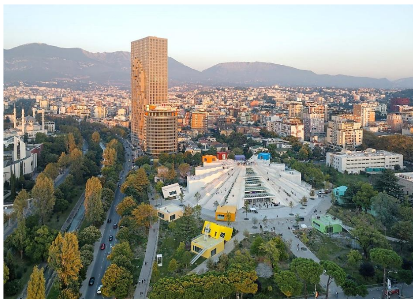
Рис. 2. Пирамида Тираны после реконструкции 2 Fig. 2. The Pyramid of Tirana after the reconstruction

Как говорил сооснователь бюро Вини Маас, который руководил проектом: «Это здание – символ для многих албанцев: для старших поколений – память о событиях в коммунистическую эпоху, для молодежи – место празднования новой эры. Они будут использовать его для встреч и прогулок, а также для концертов и собраний. Мы сделаем балки доступными и безопасными, чтобы мы могли подняться на вершину и отпраздновать восхождение с видом на город Тирана. Мы создаем живой памятник для всего населения» [12].