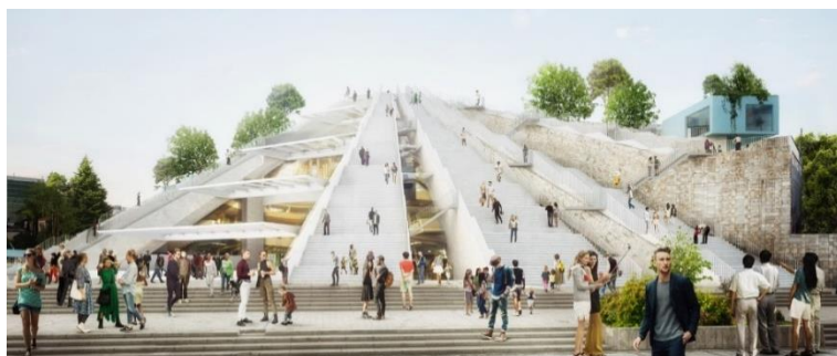
Рис. 3. Вид на Пирамиду 3 Fig. 3. The Pyramid of Tirana from eye level

мация, кинематография и музыка [14]. Другая часть кубов сдается в аренду и используется как кафе, офисы и лаборатории.