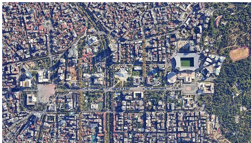
Рис. 5. Пирамида в контексте современной застройки Тираны Fig. 5. The Pyramid of Tirana amidst contemporary urban landscape

Функция медиатора как связующего звена между разными сторонами обретает форму. Открытость пространства, прозрачность стен становятся символами связи настоящего и будущего, а сохранение первоначального каркаса вместо сноса здания – память о прошлом, которое повлияло на то, каким город является сейчас [16]. Пирамида объединяет разные поколения: тех, кто наблюдал за строительством здания, кто приходил на заброшенную Пирамиду, чтобы насладиться видом на город, и кто сейчас посещает образовательный центр в ее стенах (рис. 5).