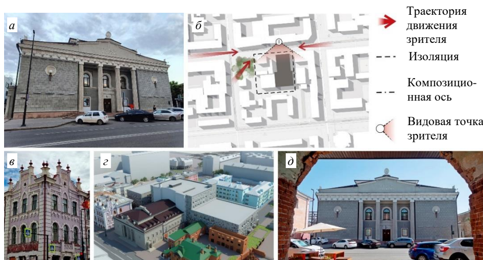
Рис. 3. Красноярский драматический театр имени А.С. Пушкина: a – главный фасад 10 ; б – анализ взаимодействия театра с окружением; в – фрагмент фасада здания камерной сцены 11 ; г – 3D-модель 12 ; д – вид с точки № 1 с ограниченной видимостью 13

театр ресерсји: объекту, принимающему зрителя, но не излучающему активность в городскую среду.