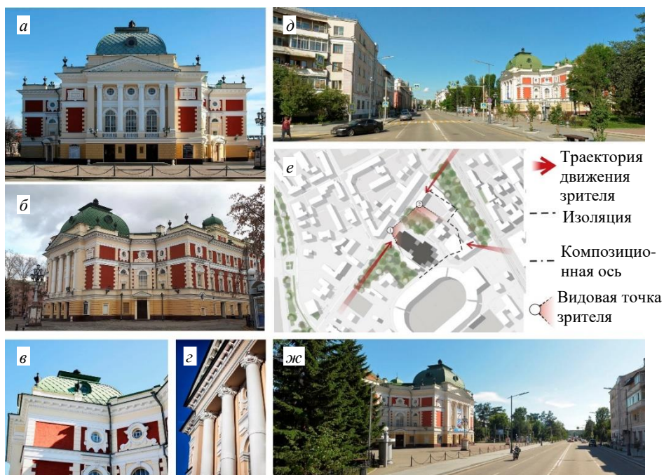
Рис. 4. Иркутский академический драматический театр им. Н.П. Охлопкова: а – главный фасад 14 ; б – боковой фасад 15 ; в – фрагмент, боковой фасад 16 ; г – фрагмент, главный фасад 17 ; д – вид с точки № 1 18 ; е – анализ взаимодействия театра с окружением; жс – вид с точки № 2 19

С точки зрения Б.-Ю. Сюя, Иркутский академический драматический театр демонстрирует преимущественно связную структуру в своем взаимодействии с городской средой при наличии локальных участков разрыва (рис. 4, e).