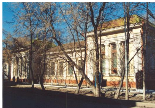
Рис. 7. Городская хирургическая больница (совр. ул. Даудельная, 1Б), план 1-го этажа и фотография автора 2019 г.